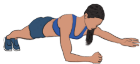
E Plank - Arm check