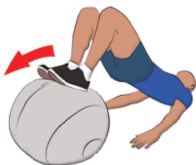
Ball Leg Curl